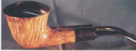
Straight Grain med sort blankpoleret top.

Hvor meget farve og åretegning kan betyde, ses i en Straight Grain med sort blankpoleret top, en klassisk model som har fået en nutidig