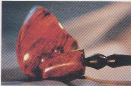
Straight Grain med indstik-spids.